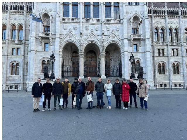
Cultural programmes in Budapest

Am zweiten Tag besuchten wir Budapest, wo unsere Gäste die wichtigsten Gebäude und Sehenswürdigkeiten unserer Hauptstadt kennenlernen konnten. Wir machten einen fachlichen Besuch an der Keleti Károly Wirtschaftsfakultät der Universität Óbuda. Wir hatten zwei Tage aktiver Arbeit in einer angenehmen Atmosphäre. An dieser Stelle möchten wir allen danken, die uns bei der Umsetzung unseres Projekts und des Treffens unterstützt haben.